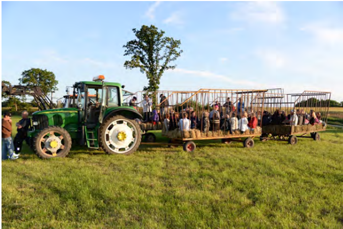
Hejde Kors och Tvärs 2015 på Träskmyr